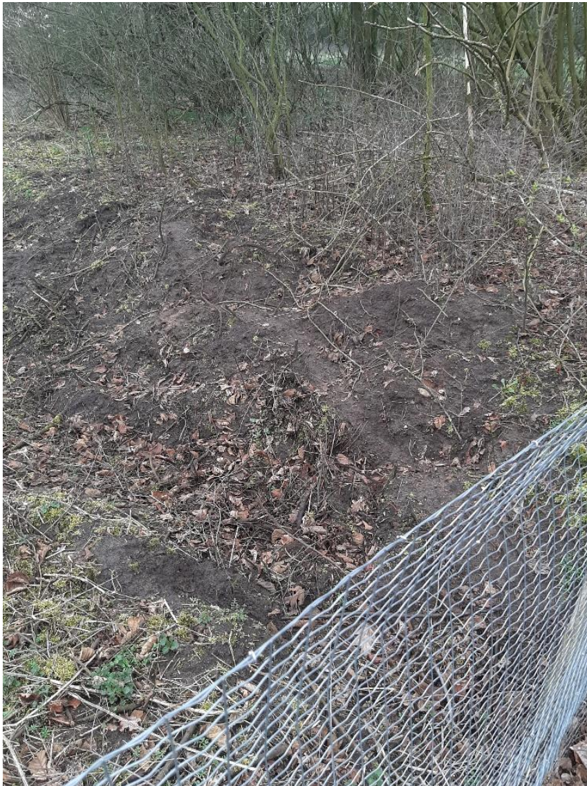
Foto 1. Dassenwissel, Hunnenweg, Voorthuizen, 22 maart 2023.