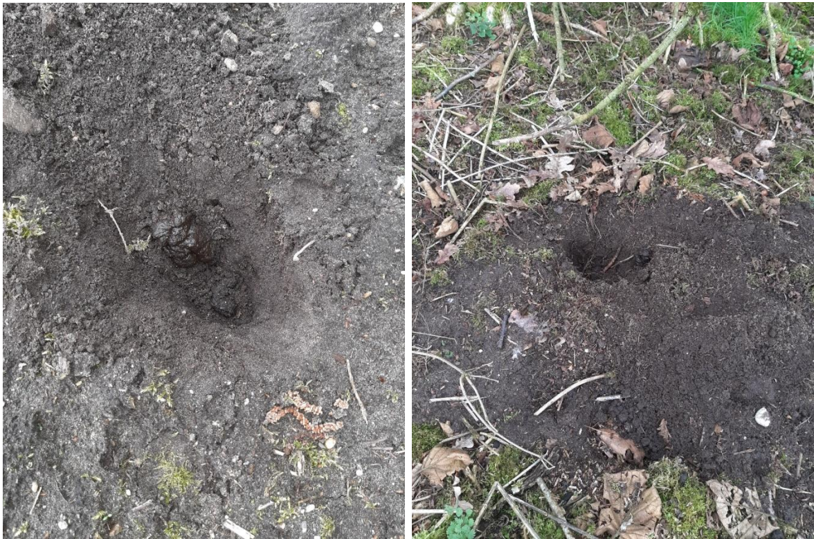
Foto 4. Beddengoed voor de ingang van een pijp, Hunnenweg, Voorthuizen, 22 maart 2023.